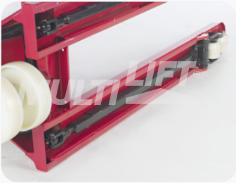
Construcción ultra reforzada.