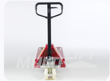
Maneral de operación con manija de 3 posiciones.