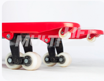
Ruedas de Nylamid tipo tándem.