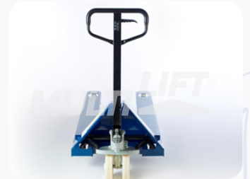
Maneral de operación con manija de 3 posiciones.