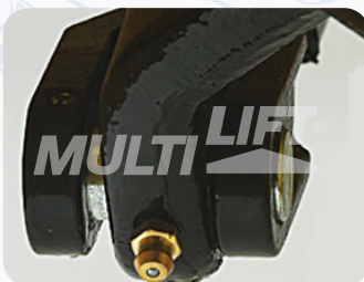
Graseras de lubricación en puntos clave.

Su mejor opción para manejar contenedores de medidas especiales con un largo de hasta 2.30 mts.