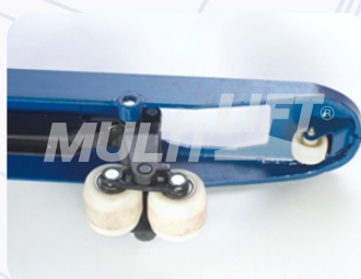
Rodillos de entrada y salida adicionales.