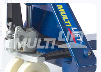
Bomba hidráulica de una sola pieza, que maximiza eficiencia y productividad.