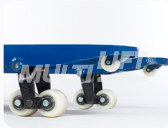
Ruedas de Nylamid tipo tándem.